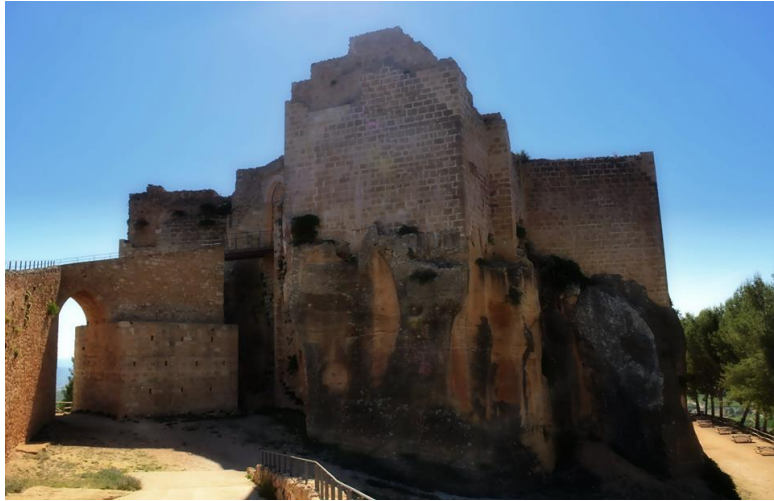
Preciosa Imagen de Bolbaite